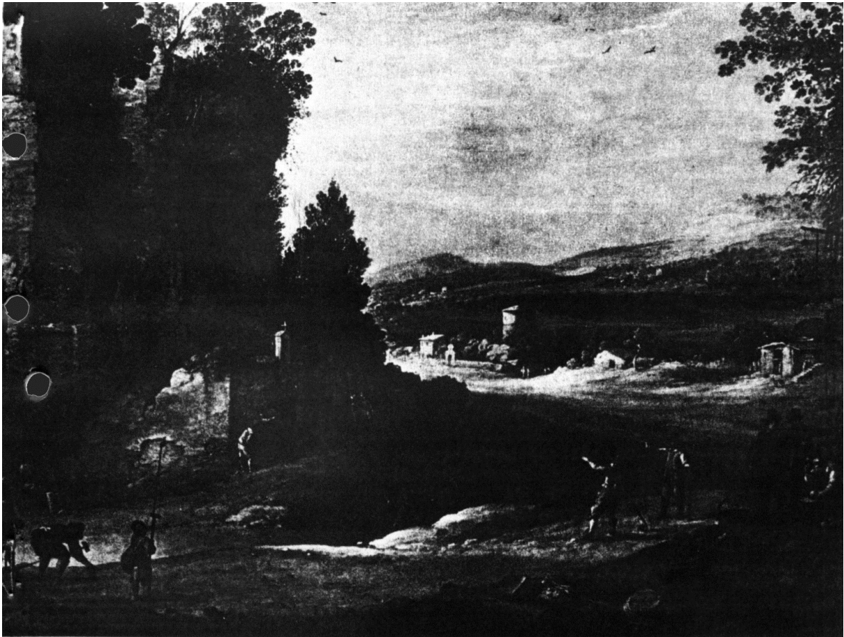
„De chole-spelers” door Paulus Bril (1554—1624); collectie O. M. Leland, in het Minneapolis Institute of Arts.