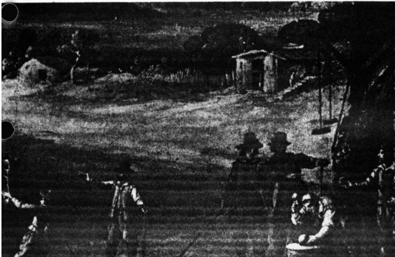
Nog een fragment — De spelende mannen hebben elk een anders gevormden stok in de hand. De man vóór de werkplaats vormt een houten bal.

Wij hebben golf in alle toon-aarden hooren bezingen, doch een zoo merkwaardige, zij het ietwat chauvinistische karakteristiek van de "Royal & Ancient Game" lazen wij nog niet eerder.