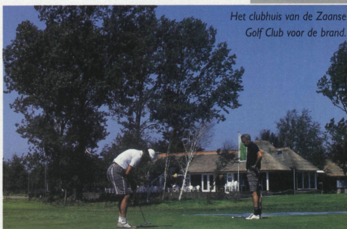
Het clubhuis van de Zaanse Golf Club voor de brand.

Op Spaarnwoude, Houtrak en de Zaanse is de brand begonnen in de proshop. De golfwinkel op Houtrak ►►