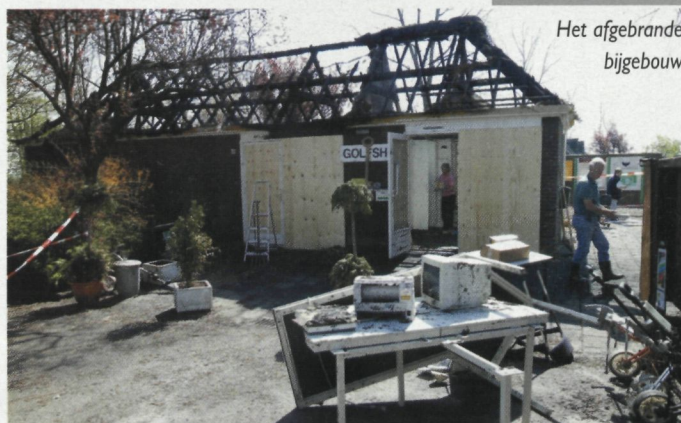
Het afgebrande bijgebouw