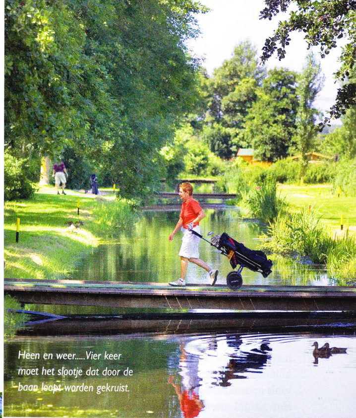
Heen en weer....Vier keer moet het slootje dat door de baan loopt worden gekruist.

Links en rechts op de parkeerplaats gaan achterkleppen open. Maar het zijn niet alleen golftrolleys die eruit komen. Sterker nog, in de meeste gevallen zijn het kinderbuggies die tevoorschijn komen. Het is niet de vaste ochtend van de peuterafdeling van de Voortschotense Golfclub, nee golfers en zwemmen blijken naaste burens te zijn en zelfs een aantal faciliteiten te delen. In Amerika heeft elke behoorlijke country club een eigen zwembad maar hier in Nederland is Voorschoten de enige golfbaan waar golf en