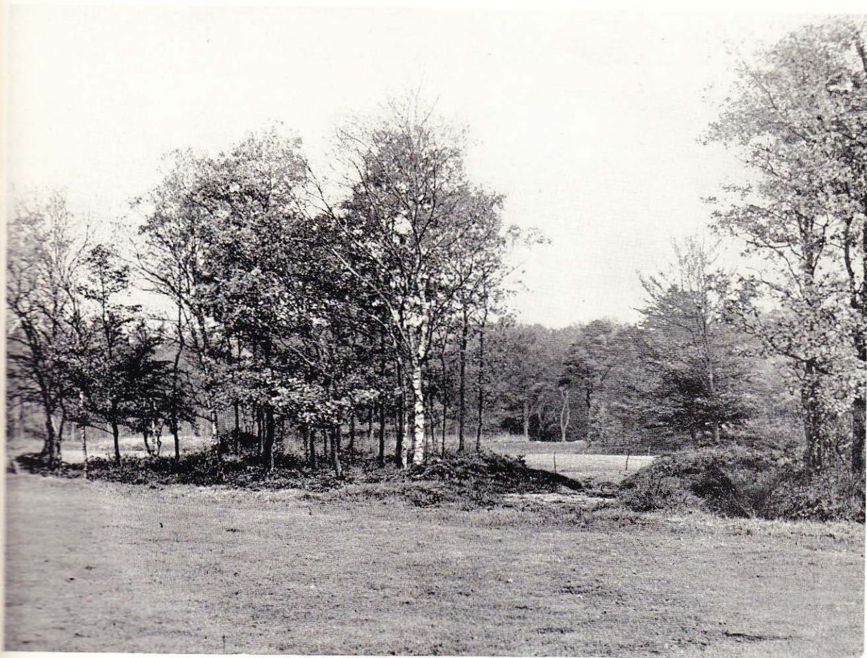
Noord-Ned. G. & C.C. - Een kijkje op de mooie maar moeilijke 7e hole. Tussen de berk in het midden en de bomen rechts loopt de fairway naar de 7e green (op de achtergrond bij „de gedraaide boom”). Enkele veranderingen zullen de hole iets gemakkelijker maken dan ze zo op 't oog lijkt

*) Zie GOLF , 16e jrg. no. 7, Juli 1952.