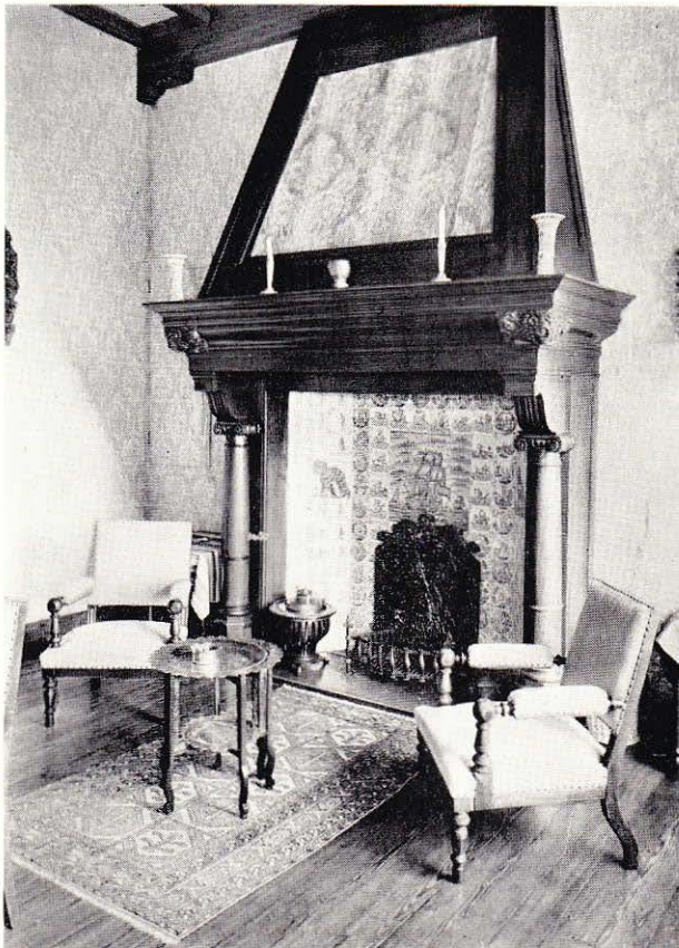
Noord-Ned. G. & C.C. - De fraai betegelde schouw in de eetkamer

Toen kwamen de plagen: het wroeten van mollen, het graven door konijnen en hier en daar schimmelziekte in het grasbestand. De strijd tegen mollen en konijnen vindt onverminderd voortgang, de schimmelziekte werd, naar zich laat aanzien, reeds overwonnen. Langzaam doch gestaag is voortgewerkt aan de vervolmaking van „De Poll”. Langzaam omdat ook de huidige, tijdelijke baan op het vliegveld Eelde steeds veel verzorging en aandacht vroeg en vraagt en het technisch personeel zijn werkzaamheden over beide banen moet verdelen.