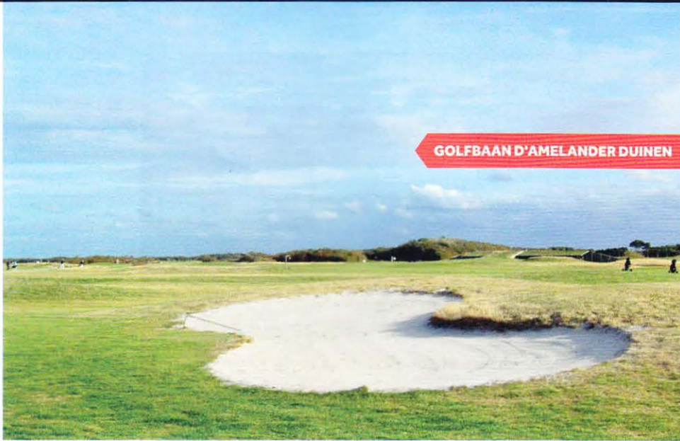
GOLFBAAN D'AMELANDER DUINEN