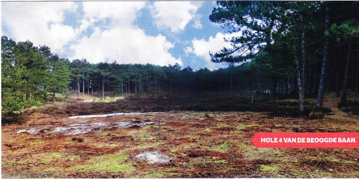
HOLE 4 VAN DE BEOOGDE BAAN