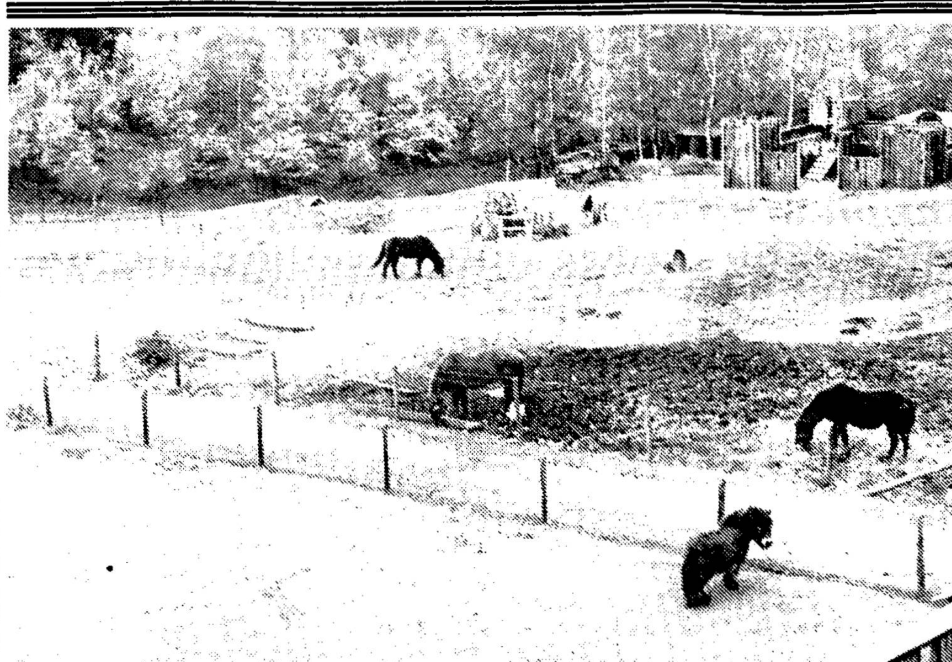
● Het 'buitengebeuren' van de kinderboerderij in Vijlen komt er op niet al te lange termijn geheel anders uit te zien.

„Het is weinig elegant dat die benoemingen al rond waren voordat de betrokken gemeenteraden daarover in kennis werden gesteld. Bovendien vinden wij (CDA-fractie, red.) dat de golfclub recht heeft op een zetel in de Raad van het Bestuur. Deze club heeft alle belang bij een goede exploitatie van de baan en zal zeker een deskundige vertegenwoordiger kunnen aanwijzen”. Of het CDA ook zonder deze bepaling akkoord zal gaan met het raadsvoorstel, is nog niet zeker. „Maar in ieder geval nemen we de medezeggenschap voor de golfclub hoog op”, aldus Schiltmans.