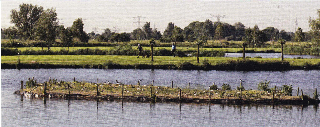
Visdiefjes broeden op het eilandje tussen hole twaalf en zestien.

streekeigen bomen zijn inmiddels tot wasdom gekomen: knotwilgen, hoge populieren, meidoornhagen en aaneengesloten groepen abelen. Mooi om te zien, maar hindernissen die je als speler lelijk in de weg kunnen zitten.