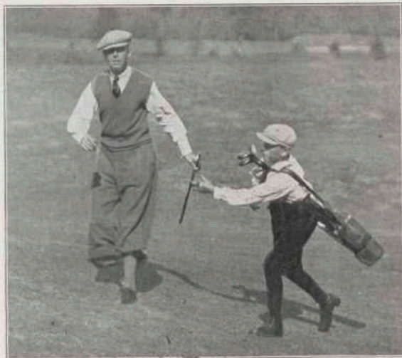
Nog een herinnering aan het kampioenschap, vorige week verspeeld.